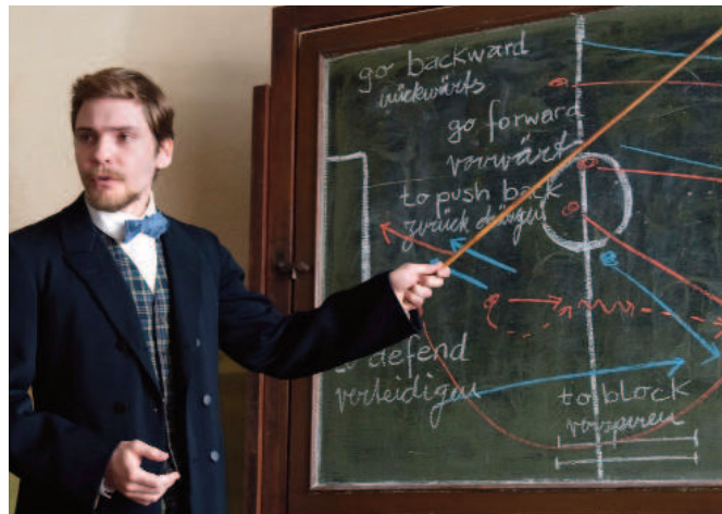
Der ganz große Traum, Alemania, 2011