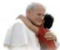
Juan Pablo II

En 1951 se ordenó sacerdote, obteniendo el doctorado en Teología dos años después. Desde 1952, fue encargado de Dogmática y Teología en Freising, y posteriormente profesor ordinario en Bonn, Münster, Tubinga y Ratisbona, donde también fue Vicepresidente de esa universidad.